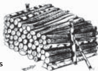
Gîte tas de bûches